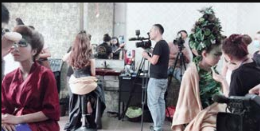
THI TAY NGHỆ TRẺ CQG NĂM 2018 Thi Thực Hành Trang Điểm Fantasy