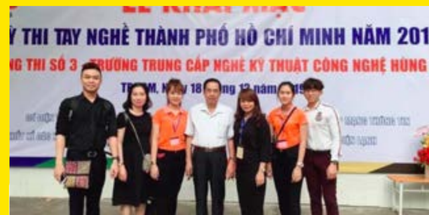
THI TAY NGHỆ TRẺ CQG NĂM 2019 Bộ Môn Kỹ Thuật Tóc