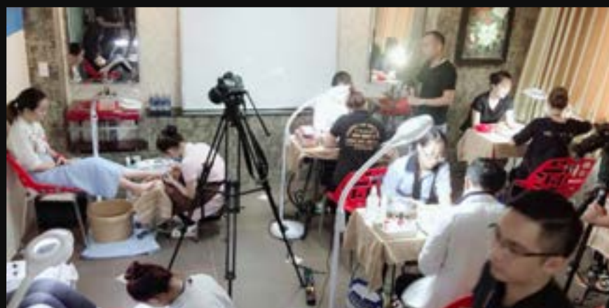
THI TAY NGHỆ TRẺ CQG NĂM 2018 Thi Thực Hành Làm Móng