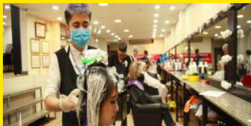
THI TAY NGHỆ TRẺ CQG NĂM 2018 Thi Thực Hành Thiết Kế Kiểu Tóc